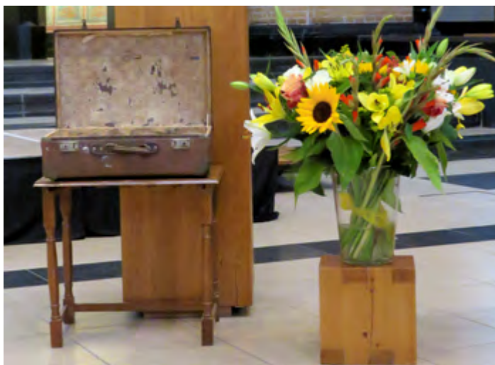
▲ Het koffertje van Titus, dat hem tot op zijn laatste reis vergezeld heeft. Een stille getuige.