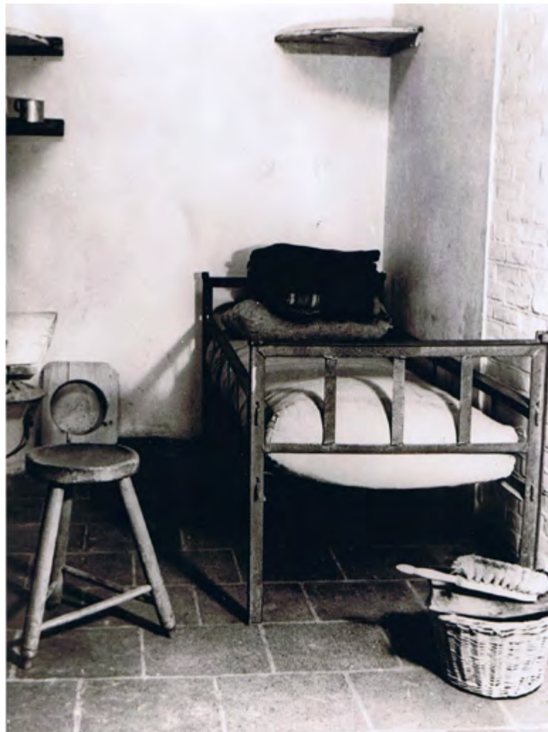
▲ Cel in strafgevangenis van Scheveningen.

"Beata Solitudo. Ik ben er al helemaal thuis in dat kleine celletje. Ik heb mij er nog niet verveeld, integendeel. Ik ben er alleen, o ja, maar nooit was Onze Lieve Heer mij zo nabij. Ik kan het uitjubelen van vreugde, dat Hij zich weer eens geheel heeft laten vinden, zonder dat ik bij de mensen of de mensen bij mij kunnen. Hij is nu mijn enige toeverlaat en ik voel me veilig en gelukkig.